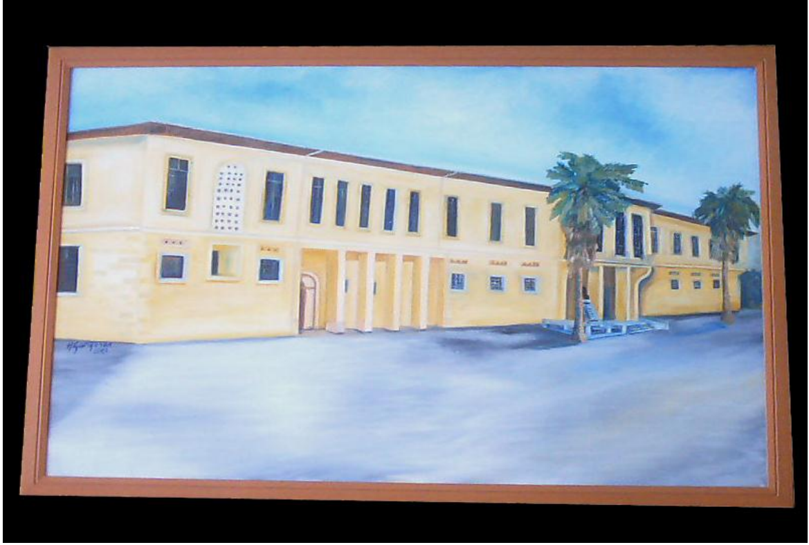
OKULUMUZUN ESKİ BİNASI