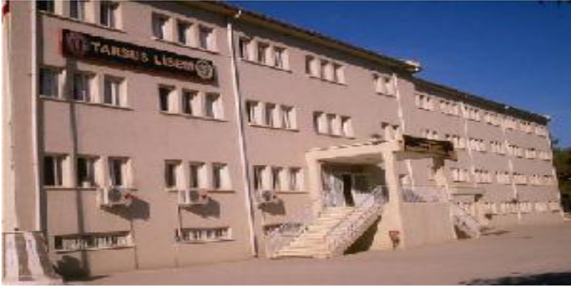
OKULUMUZUN YENİ BİNASI